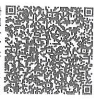
李正宇年检二维码

本证书经检验合格, 继续有效一年。 This certificate is valid for another year after this renewal.