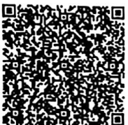
李正宇年检二维码